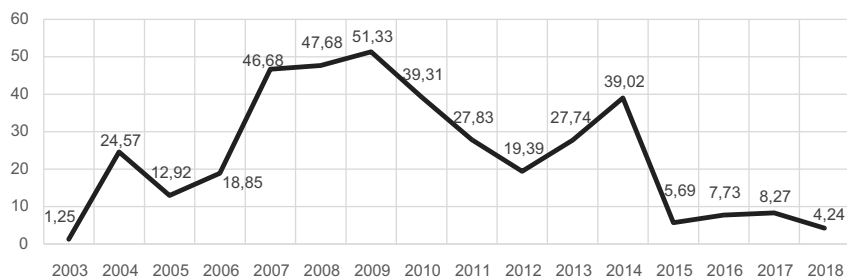
Рис. 1. Официальная турецкая помощь развитию Ирака, 2003–2018 гг. (млн долл., в текущих ценах)

Взаимодействие Турции и Ирака по модели «донор–реципиент» ('donor-to-recipient' model) [см., например: Adelman, 2009: 23] в сфере оказания экономической и гуманитарной помощи было налажено задолго до 2014 г. С начала 2000-х годов Ирак входил в двадцатку основных реципиентов турецкой официальной помощи развитию (ОПР). Традиционно отдавая предпочтение двусторонним каналам взаимодействия [Kulaklıka, Nurdun, 2010: 139; Zengin, Korkmaz, 2019: 111], Турция предоставляла ОПР соседнему государству в трех формах: гуманитарная помощь (выделение продовольствия, медикаментов и создание палаточных лагерей); развитие жизненно важных производственных секторов экономики (например, сельского хозяйства); финансирование проектов в области инфраструктуры и строительства [см. подробнее: Murphy, Sazak, 2012: 8]. В общей сложности до провозглашения «ИГ», в 2003–2013 гг., Турция выделила Ираку 317,55 млн долл. (рис. 1). Самые крупные объемы помощи были при этом предоставлены в 2007–2009 гг. — период активизации политических и деловых отношений Турецкой Республики с иракскими центральными властями и Региональным правительством Курдистана и запуска новых инициатив в рамках трехстороннего сотрудничества [см., например: Свистунова, 2013: 39].