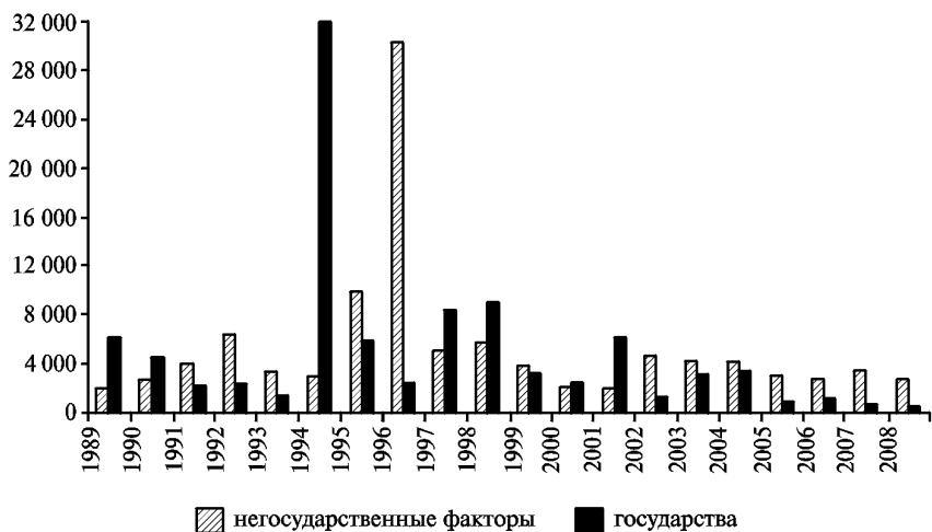
Рис. 2. Число убитых в результате одностороннего насилия со стороны государств и негосударственных акторов, 1989—2008 гг.

действий между комбатантами (в том числе от партизанских атак по военным объектам противника), а с другой — объясняет, почему терроризм так тесно связан с вооруженными конфликтами и наиболее часто применяется именно в контексте вооруженных конфликтов .