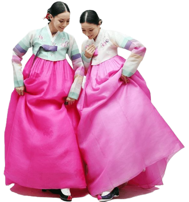
Девушки в национальной одежде ханбок