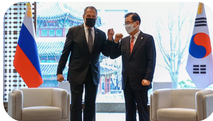
Глава МИД Южной Кореи Чон Ый Ён на встрече с главой МИД РФ Сергеем Лавровым