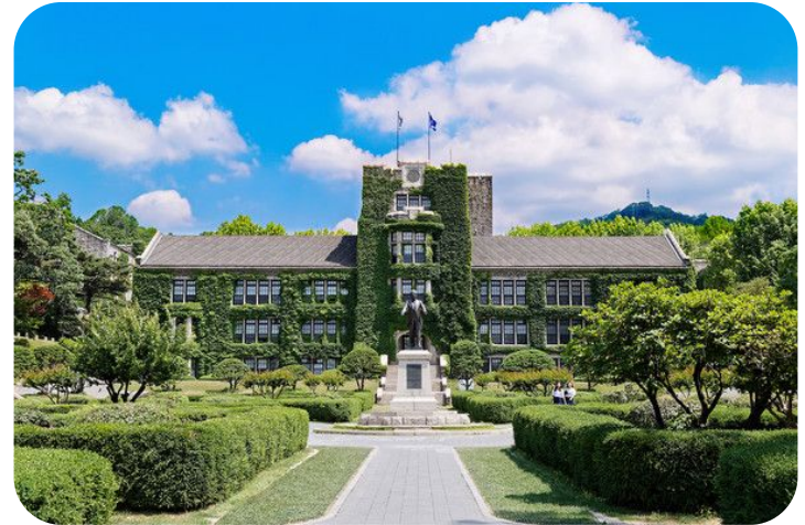
Кампус университета Ёнсе в Сеуле

Кроме того, Корейский национальный институт международного образования NIIEP предоставляет ряд грантов на бесплатное обучение в лучших вузах страны (отбор проходит на конкурсной основе).